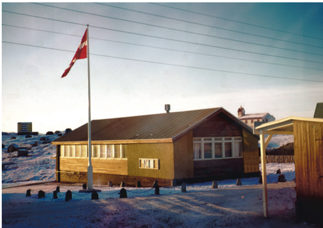
Kæmnerkontoret i Narsaq 1962.

af 1950 (G50) anbefalede, at kæmnerne også skulle stå for regnskabsvirksomheden, hvilket trådte i kraft i 1952. De nye regnskabsopgaver bestod af: a) indkassering af renter på statslån, b) lønudbetaling i relation til kirke, politi, retsvæsen, elværket, skolevæsenet, lægevæsenet mv. (Jensen 1954; Knudsen 1960).