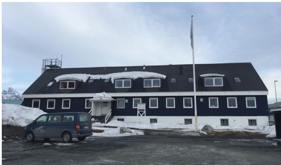
Administrationsbygningen, hvor landsrådet og arbejds- og socialdirektoratet holdt til fra 1967-1975.

Den politiske side af det sociale arbejde forblev formelt set et dansk anliggende, indtil indførelsen af Grønlands Hjemmestyre i 1979, men centraladministrationen lå i Nuuk.