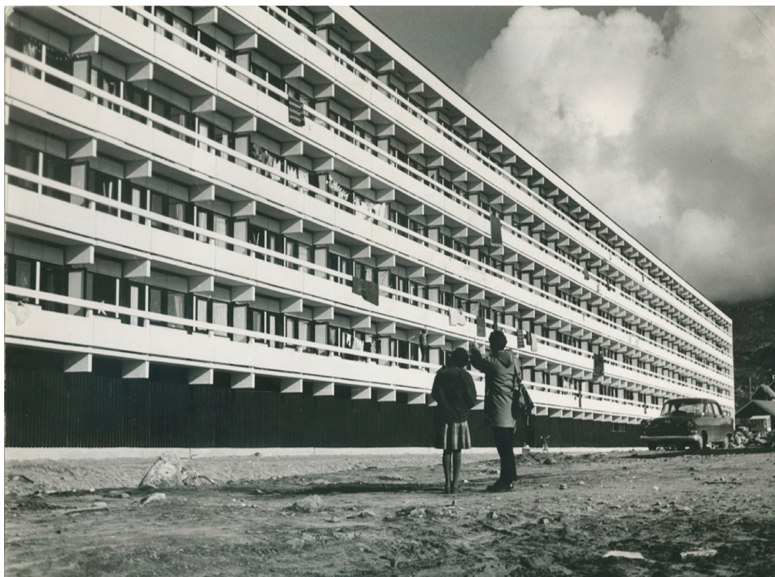
Blok P, som stod færdig i 1965, var om noget en indikation på stor tilflytning til Nuuk.

og socialhjælpere, der skulle arbejde for de kommunale forsorsudvalg og yde bistand i form af rådgivning- og undersøgelsesopgaver.